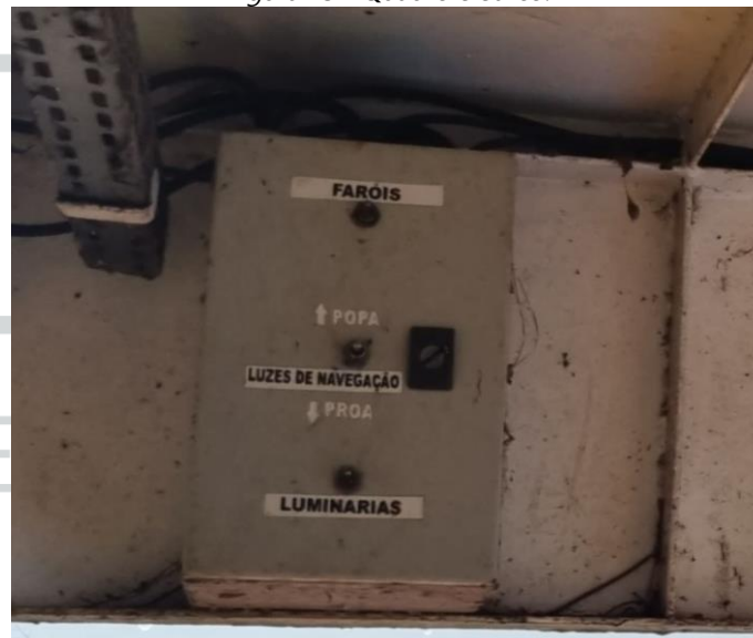
Figura 15 - Quadro elétrico.

18) Substituir quadro elétrico. O quadro elétrico deve manter as funções de ligação das luzes de navegação de proa e popa, luminárias e iluminação do convés.