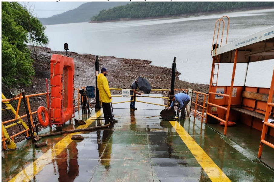
Figura 12 - Alteração da posição do aparelho flutuante.

15) Base para o aparelho flutuante acima da casaria. O aparelho flutuante terá sua posição alterada, será tirado do convés principal e colocado acima do local, conforme consta no arranjo geral.