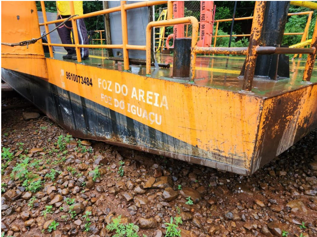
Figura 18 - Pintura do casco deve ser refeita.

26) A faixa de carga deve ser refeita, a faixa deve ter no mínimo 5 cm de largura.