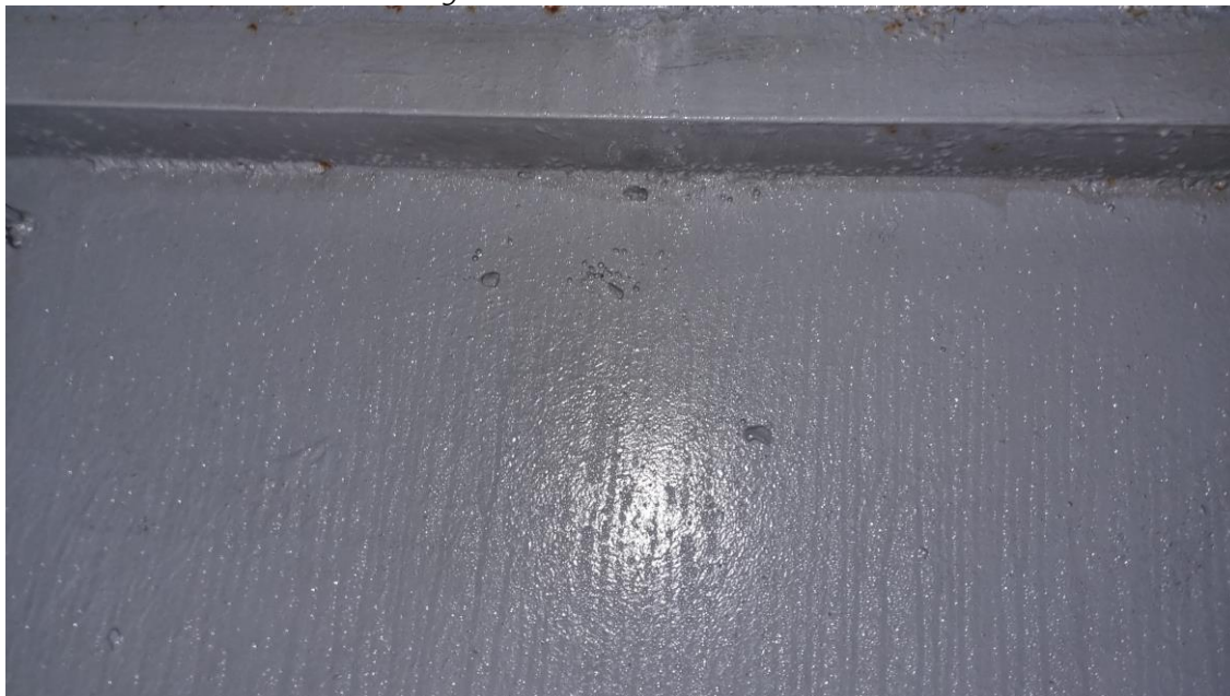
Figura 8 - Solda deve ser contínua.

12) Alterar posição dos mastros da embarcação. Devem ser posicionados nas extremidades da embarcação, na proa e popa.