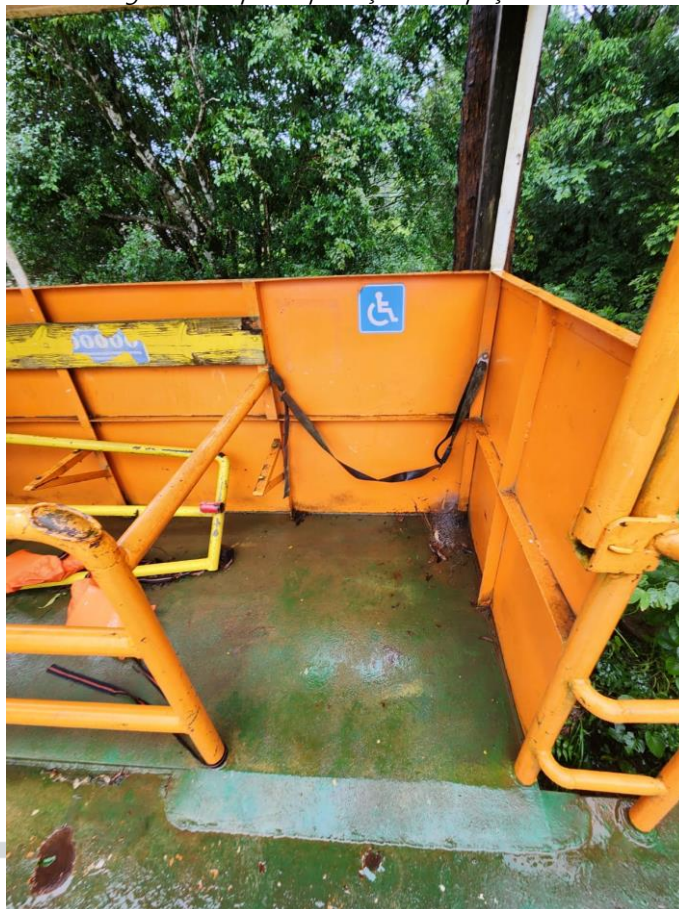
Figura 5 - Adicionar guarda corpo de proteção ao espaço destinado ao cadeirante.

6) Dotar suspiros em forma de U invertido, tendo como distância vertical entre o ponto de abertura ao convés principal 450mm, como altura mínima aceitável. Deve-se possuir um suspiro por compartimento, sendo o total de 04 suspiros.