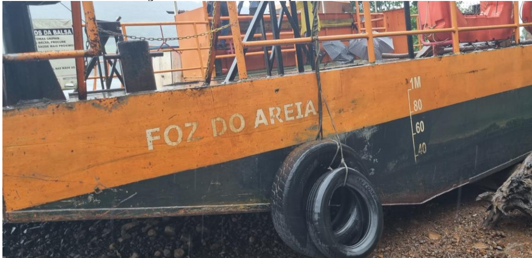
Figura 6 - Nome da embarcação deve ser soldado.

9) Soldar o porto de inscrição, sendo a que altura mínima da letra é de 10 cm.