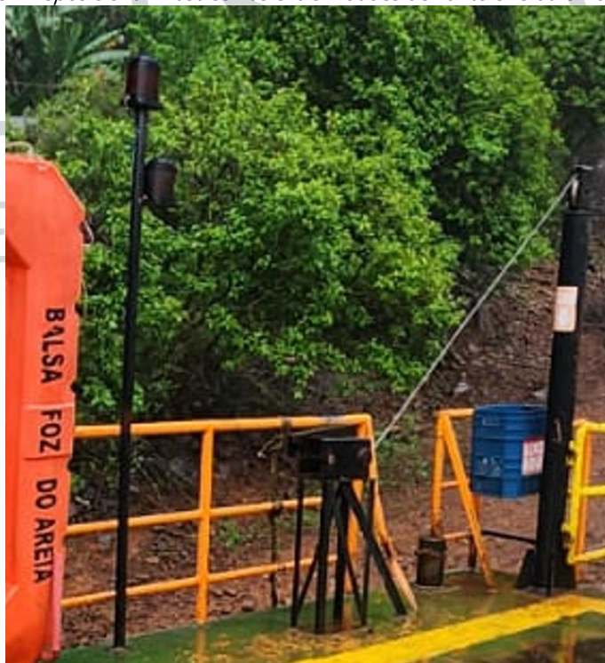
Figura 9 - Reposicionar mastros nas extremidades de vante e ré da embarcação.

12) Alterar posição dos mastros da embarcação. Devem ser posicionados nas extremidades da embarcação, na proa e popa.