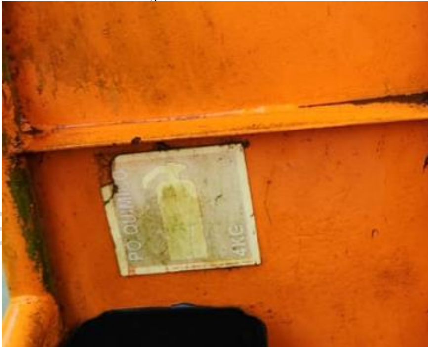
Figura 25 - Placa de extintor.

36) Trocar as boias salva-vidas com retinida. As boias salva vidas podem ser classe III, podendo ser adotada a classe II, se não for encontrada a classe III. São 02 boias com retinida.