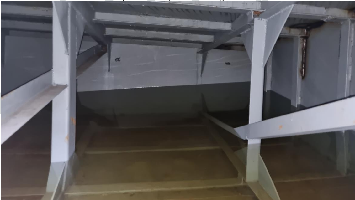
Figura 17 - Compartimentos alagados.

22) Realizar limpeza dos compartimentos internos, com escovas rotativas. É aconselhável que os perfis tenham sua limpeza com tratamento mecânico.