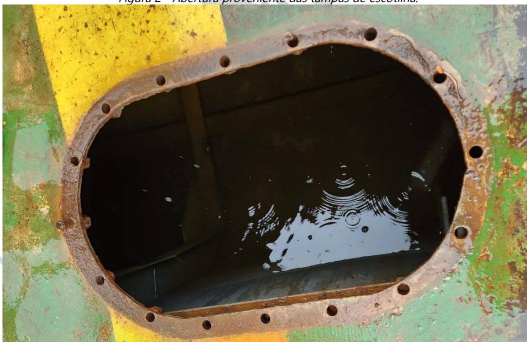
Figura 2 - Abertura proveniente das tampas de escotilha.

3) Reparar chapa do teto no local onde os passageiros ficam abrigados. Aconselhável a utilização de chapa com espessura mínima de 3/16" (aço A-36).