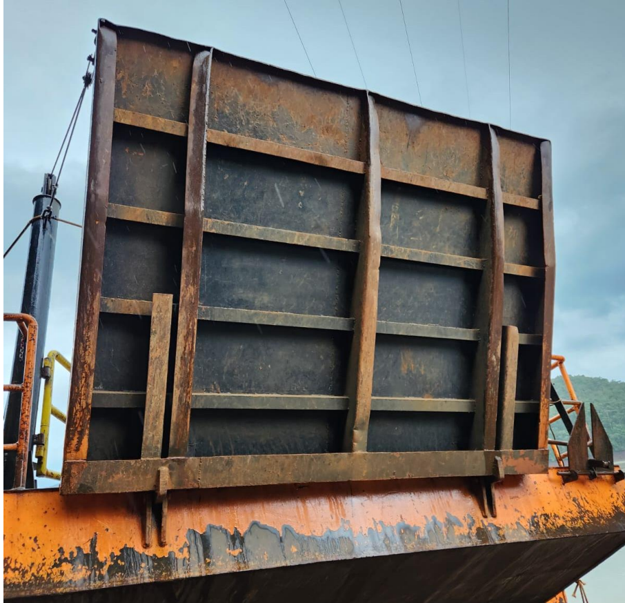
Figura 11 - Plataforma de embarque e desembarque.

15) Base para o aparelho flutuante acima da casaria. O aparelho flutuante terá sua posição alterada, será tirado do convés principal e colocado acima do local, conforme consta no arranjo geral.