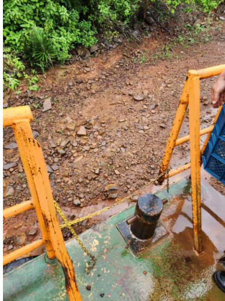
Figura 22 - Corrente inox.

32) Trocar dobradiças dos portões e trava a fim de manter o portão rígido quando travado. As dobradiças devem ser de aço 1020. Além disso, deve-se trocar os tubos amassados do portão. Total de tubos necessários 24 m, tubo 1.1/4" SCH40.