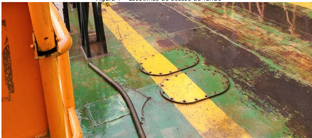
Figura 1 – Escotilhas de acesso ao fundo

2) Fechamento das escotilhas antigas, deverão ser soldadas com solda contínua. As dimensões da abertura antiga é de 600x400mm. Serão 08 aberturas que deverão ser fechadas. A chapa a ser colocada deverá manter o padrão da original, 5/16" (Aço A-36).