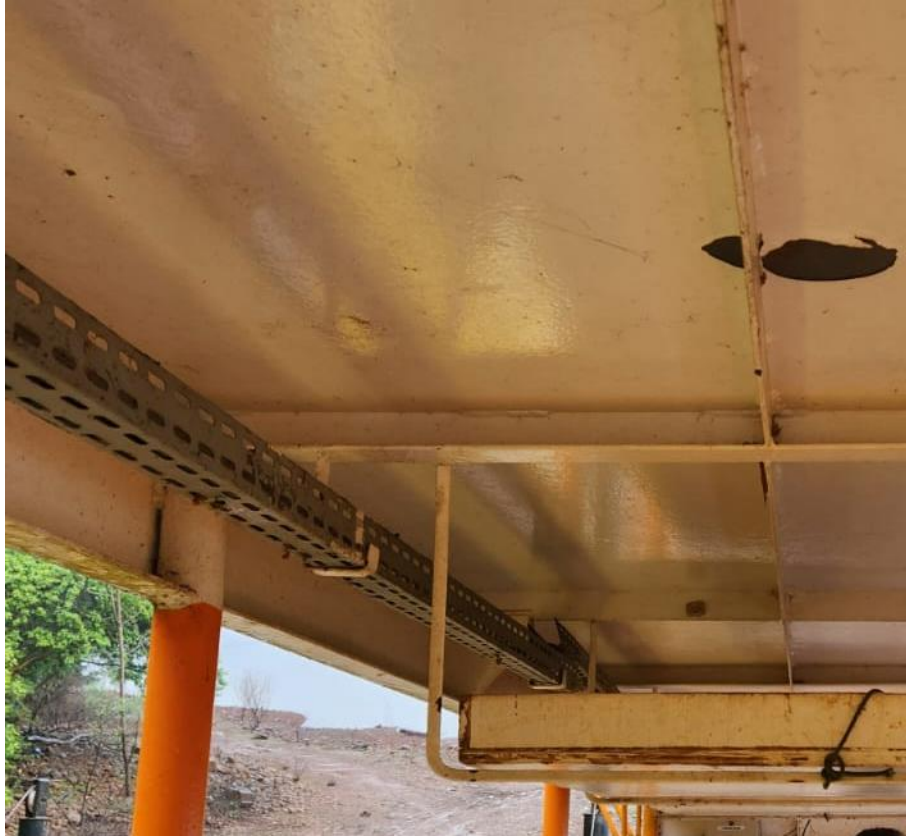
Figura 13 - Elétrica

17) Substituir luminárias em led. Modelo recomendado, luminária tartaruga de alumínio fundido. Total de 04 unidades.