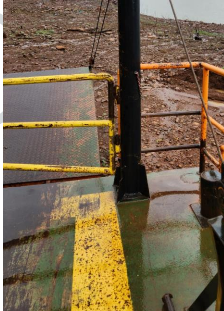
Figura 23 - Alterar dobradiças dos portões.

33) Possuir bomba 12V com vazão mínima de 4700 gph.