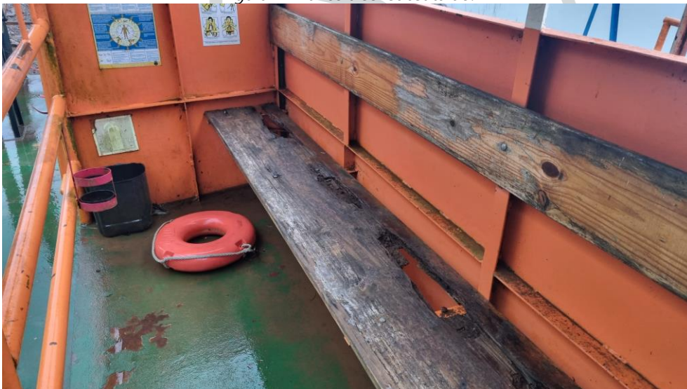
Figura 4 - Banco a ser substituído.

5) Adicionar a parte do guarda corpo inferior no espaço para o cadeirante, a altura do guarda corpo em relação ao piso deve ter no máximo 230 mm.