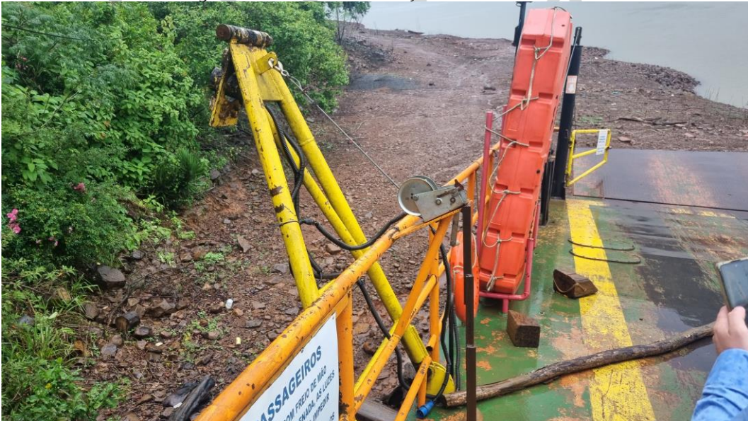
Figura 20 - Guincho de atracação dos rebocadores.

28) Lubrificar guinchos e cabos responsáveis pelas articulações das rampas de acesso a embarcação. O lubrificante deve ser a base de óleo básico, a fim de proporcionar proteção a corrosão e boa resistência ao avanço.