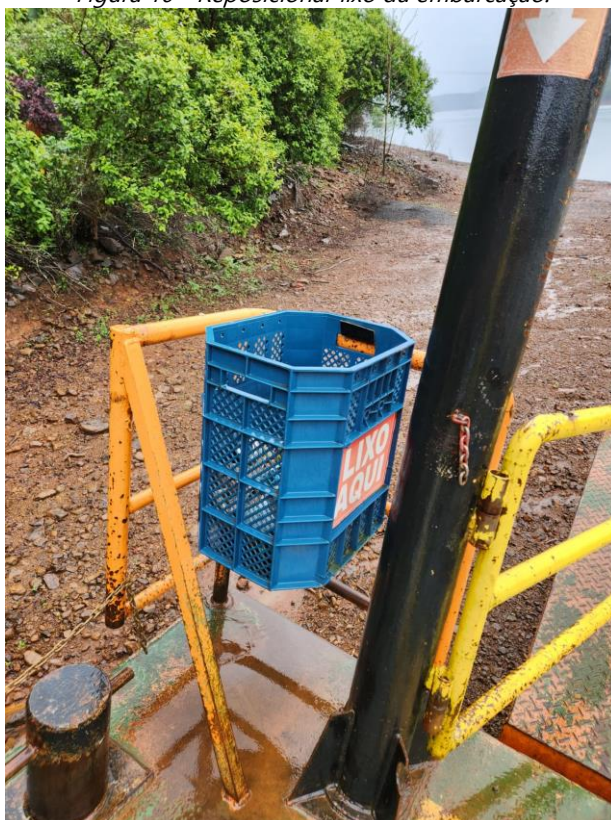
Figura 10 - Reposicionar lixo da embarcação.

14) Reforçar plataforma de embarque e desembarque. Como recomendação, incluir 02 cantoneiras longitudinais de reforço, entre as já existentes. Devem ser utilizadas perfil L5"x5/16" (Aço A-36), o comprimento necessário para seria de 10 metros.