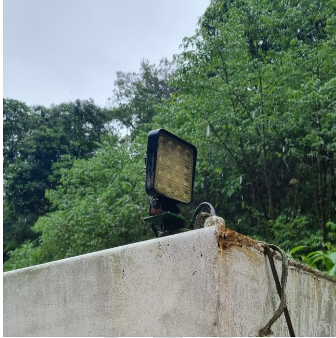
Figura 16 - Faróis em LED.