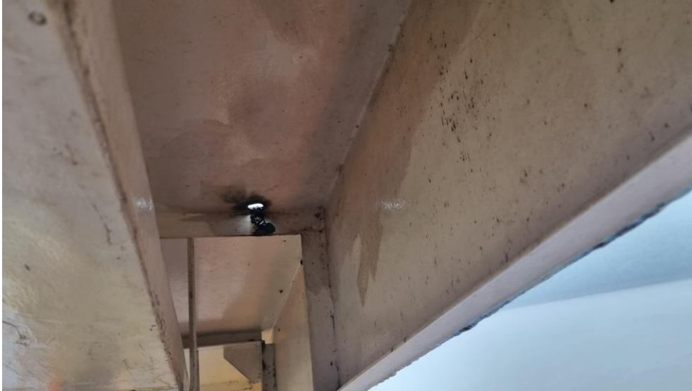
Figura 3 - Furo acima do local abrigado para passageiros.

4) Substituir os bancos destinados ao transporte de passageiros. O banco é repartido em 02 peças: