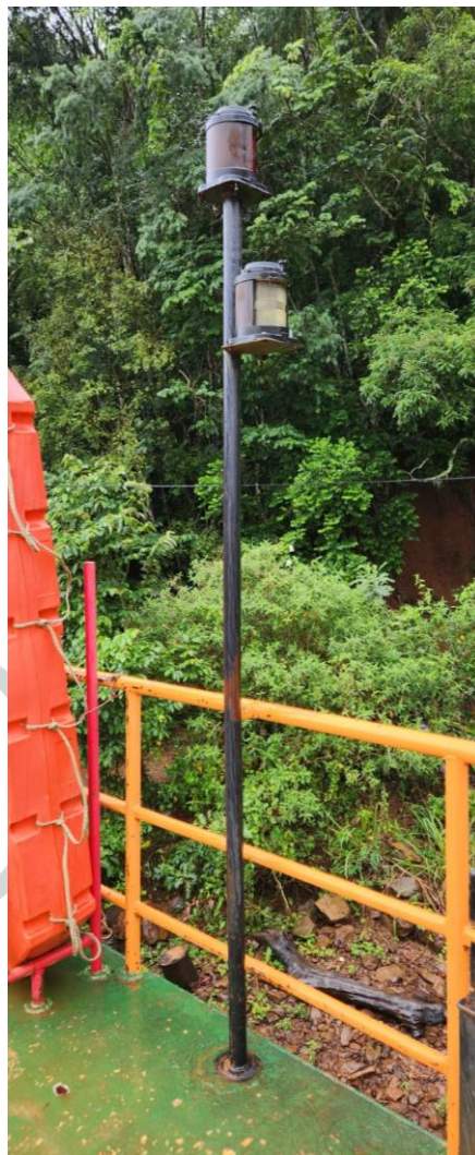
Figura 28 - Luzes de navegação.