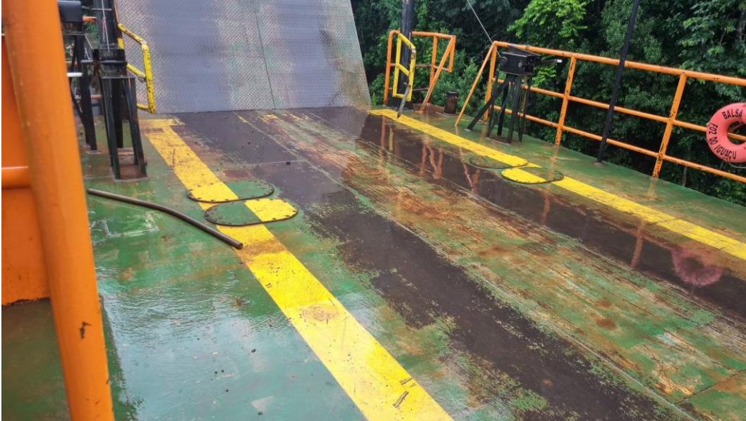
Figura 19 - Pintura da faixa de carga e convés antiderrapante.