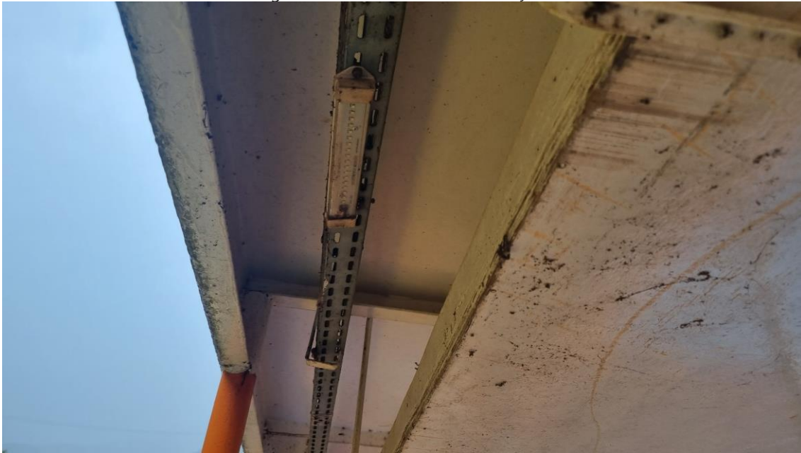
Figura 14 - Luminárias da embarcação.

18) Substituir quadro elétrico. O quadro elétrico deve manter as funções de ligação das luzes de navegação de proa e popa, luminárias e iluminação do convés.