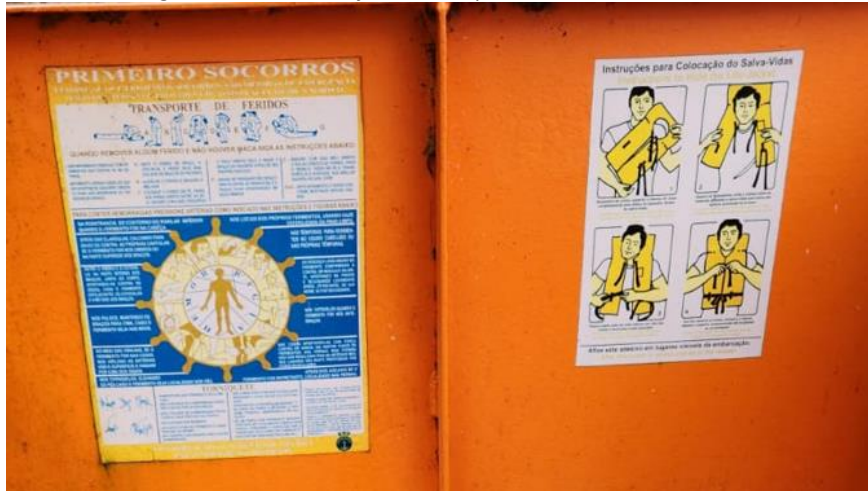
Figura 24 - Quadros informativos que devem ser substituídos.

35) Substituir placa do extintor, a placa deverá representar o extintor de pó químico 4kg