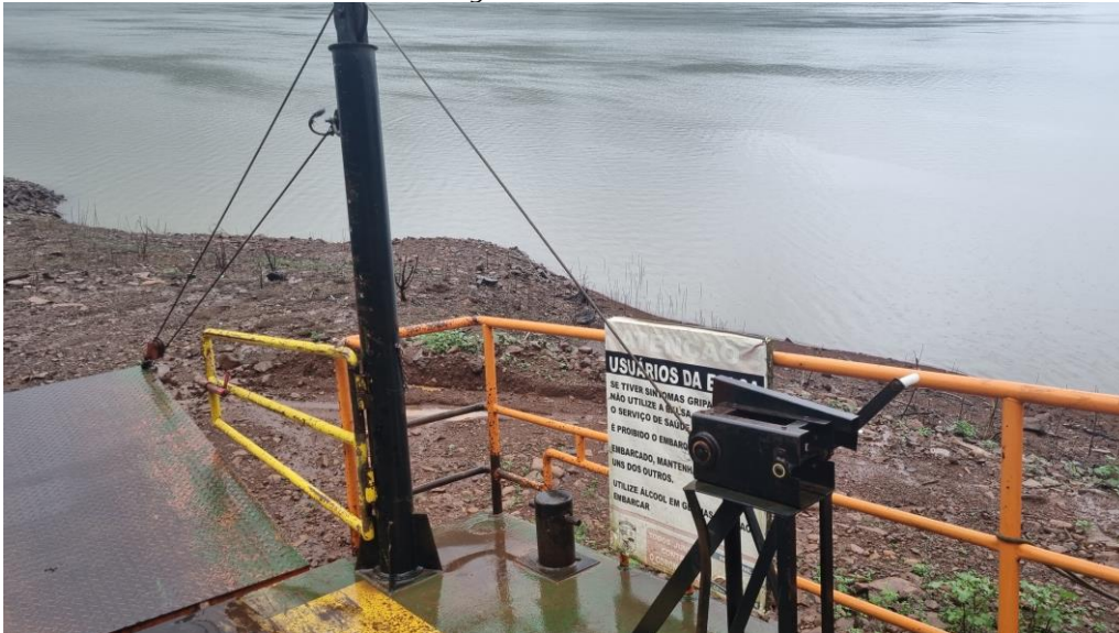
Figura 21 - Guincho

29) Adequar os guinchos da rampa de forma a prover atividade segura aos tripulantes e passageiros. Deve-se posicionar a proteção dos guinchos no sentido contrário ao centro da embarcação. A catraca do guincho é manual e deve ter travamento automático.