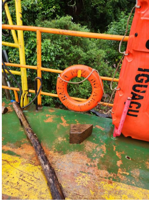
Figura 26 - Boia de salvatagem, deve ser substituída.

37) Substituir extintor. O extintor BC pode ser o de pó químico 4 kg.