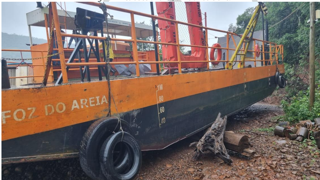
Figura 7 - Calados a vante, a meia nau e a ré.