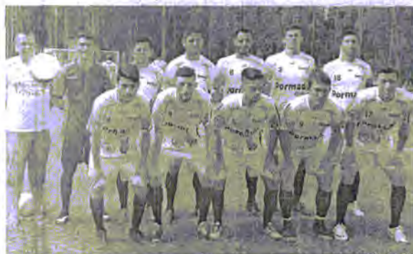
Pormade, campeã do livre