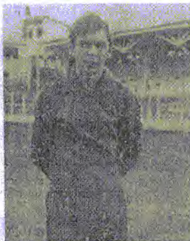
Faria nos tempos de atleta

Para o ex-atleta a chegada da Associação Atlética Iguaçu foi determinante para o “fim do futebol amador”. “Inclusive o primeiro jogo do Iguaçu foi em um amistoso contra a seleção da Liga Ama-