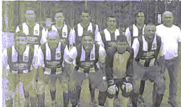
Ceará, campeão dos veteranos