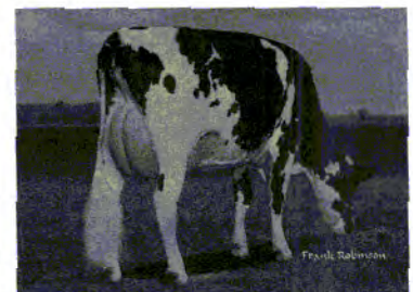
MGD: Cabernet GWN Shine