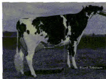
MGD: Cabernet GWN Shine