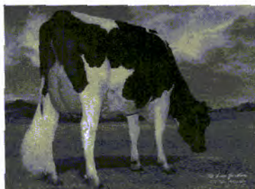
Twin-Birch Jake 2283 Twin-Birch Skaneateles, NY