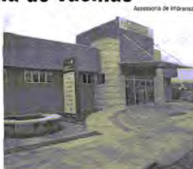
Assessoria de Imprensa

A Unidade Josmar Babi fica na Coronel Amazonas, próximo do Estádio Antiocho Pereira.